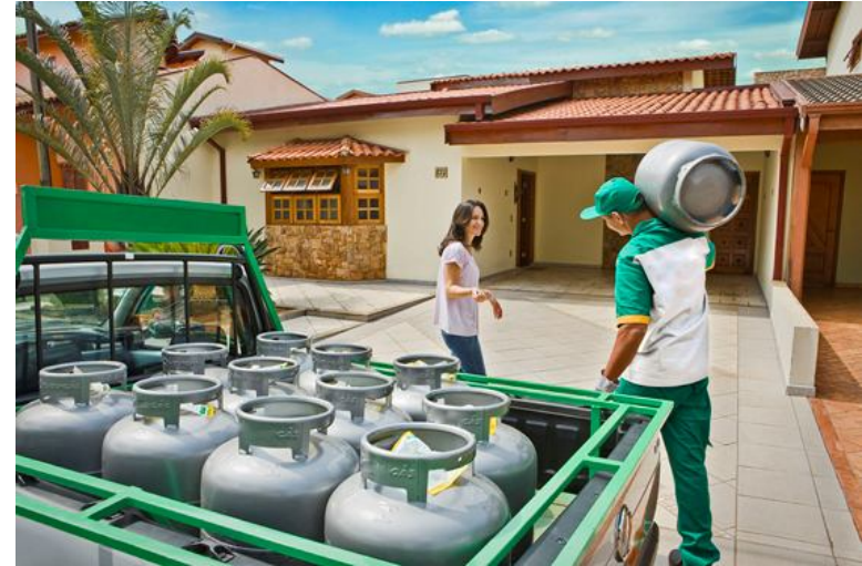
VENTA FUERA DE LA TIENDA