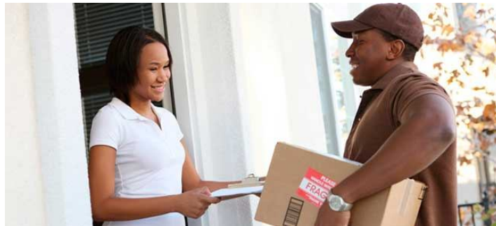
CONFIRMACIÓN ELECTRÓNICA DE ENTREGA DE MERCANCÍA