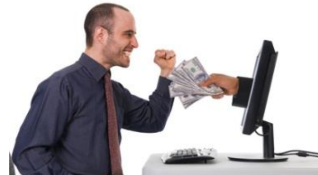
PROCESOS DE COBRO Y PAGO