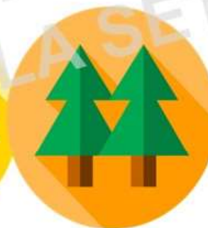
Entidades Privadas en General (sociedades, asociaciones, cooperativas, fundaciones, consorcios de obra pública)